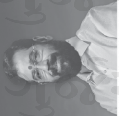
એકનાથ શિંદે મુખ્યમંત્રી