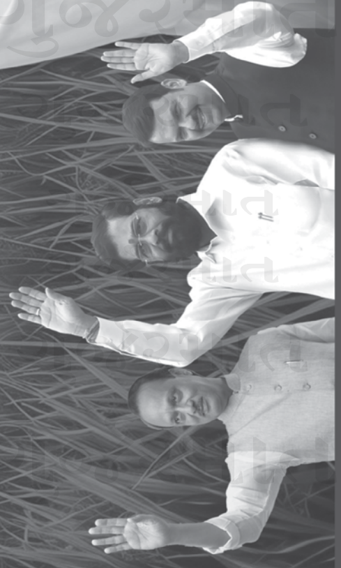
અંજિત પવાર અધ્યક્ષમંત્રી

૧.૧૫ કોટી શેતકન્યાંના રુ.૭૩૧૩.૫૧ કોટી નુકસાન ભરપાઈ મંજૂર, ત્યાપૈકી ૧૬.૭૭ લાખ શેતકન્યાંના રુ.૫૩૦૨.૧૨ કોટી વિતરીત.