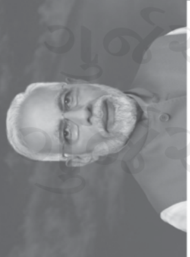
નરેન્દ્ર મોદી પ્રધાનમંત્રી