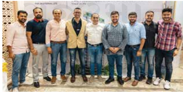
મુલુંડના યુવા ડેવલોપર્સની ટીમ