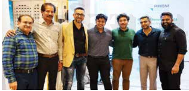
મુલુંડના નામાંકિત અને અનુભવી ડેવલોપર્સ