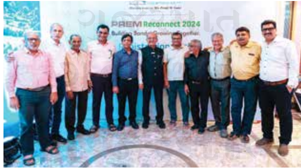
મુલુંડના રમતવીરોનો સમૂહ