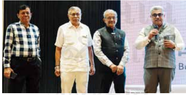
પ્રેમ ગ્રુપના સિનિયર સૂત્રધારો