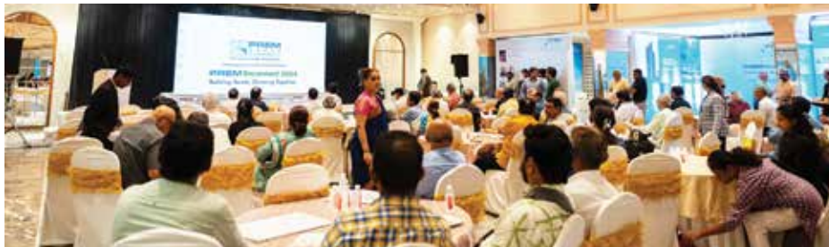
પ્રેમ ગ્રુપના સંતોષી ભૂતપૂર્વ ગ્રાહકોનો સમૂહ

'પ્રેમ ગ્રુપ'નો મુલુંડ (ઈ)માં આવેલો બીજો પ્રોજેક્ટ 'પ્રેમ બીમા છાયા' જેનું ટૂંક સમયમાં પહેલો આપવામાં આવશે તે ગ્રાઉન્ડ પ્લસ ૯ અપર ફ્લોર ધરાવે છે. આ પ્રોજેક્ટથી લીલાછમ દ્રશ્યો અને તાજી હવા સાથેના ચિંતામણી દેશમુખ ગાર્ડનનું આહ્વાદક