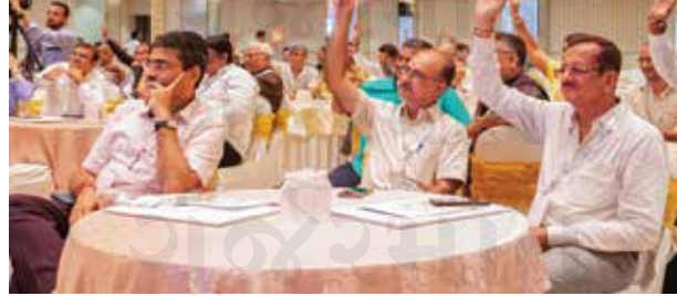
માર્ગદર્શન લેતા એસ્ટેટ એજન્ટ ભાઈઓ