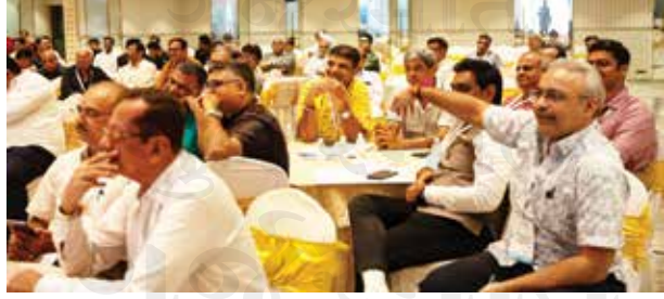
માર્ગદર્શન લેતા એસ્ટેટ એજન્ટ ભાઈઓ