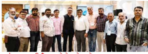
મુલુંડના અગ્રણી રિઅલ એસ્ટેટ એજન્ટો