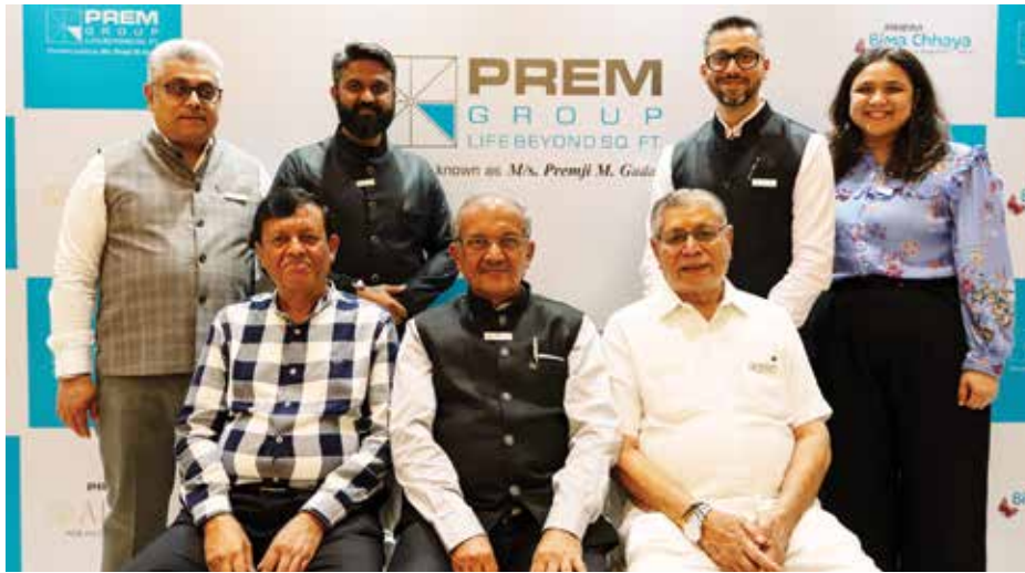
પ્રેમ ગ્રુપના સંચાલકો

મુલુંડ (વે)માં પી.કે. રોડ સ્થિત મહાકવિ કાલિદાસ કોમ્પ્લેક્સ પાસે મુરાર રોડ પર બની રહેલાં આ પ્રોજેક્ટ પરથી કાલિદાસના સ્પોર્ટ્સ