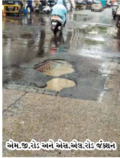
એમ.જી.રોડ અને એસ.એલ.રોડ જંકશન