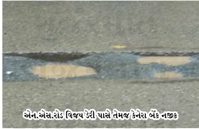
એન.એસ.રોડ વિજય ડેરી પાસે તેમજ કેનેરા બેંક નજીક