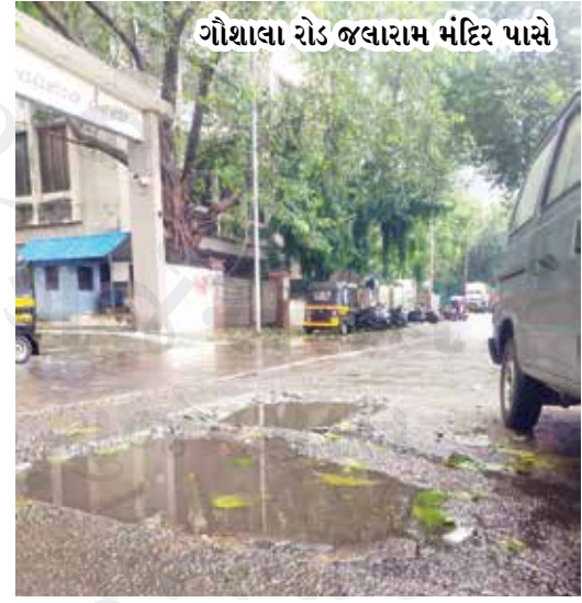
ગૌશાલા રોડ જલારામ મંદિર પાસે

સેવારામ લાલવાણી રોડ, વિઠ્ઠલ નગર પરિસરમાં જલારામ મંદિર પાસે, મહાત્મા ગાંધી રોડ, સુભાષ રોડ પર કેનરા બેંક અને વિજય ડેરી સામે એમ.જી.રોડ, સોનાપુર સિબ્નલ, બાલરાજેશ્વર સિબ્નલ, વૈશાલી નગર તથા એસ.એલ.રોડ જંકશન જેવા મહત્વના અને સતત ટ્રાફિક રહેતાં વિસ્તારો-રસ્તાઓ પર ખાડાઓને લીધે હાલાકી જોવા મળી રહે છે.