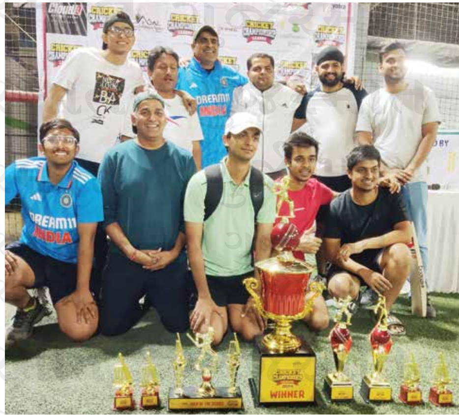
ઓબેરોય હસ્લર્સ - ચેમ્પિયન્સ