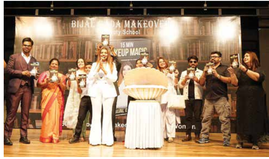
બુક વિમોચન પ્રસંગે સ્ટેજ પર મંચસ્થ મહાનુભાવો

Facebook : bijalgadamakeovers • Instagram : bijalgadamakeovers • Website : www.bijalgadamakeovers.com