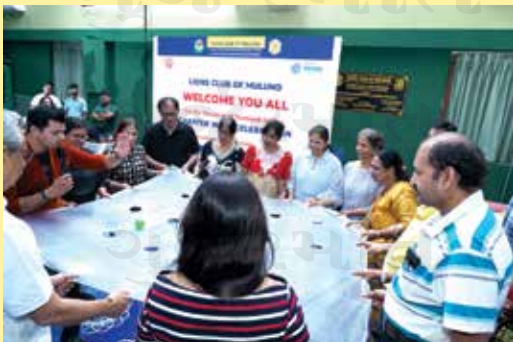
Lions Pavilion Celebrates Diamond Jubilee with Games and Karaoke Night