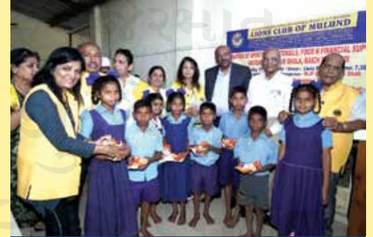
Donation of sports items, utensils, Food and financial support Ashram Shala