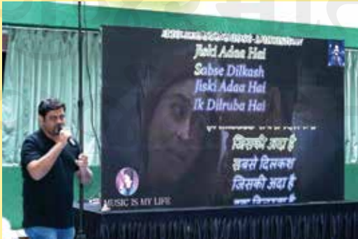
Lions Pavilion Members Delight in Karaoke Singing Extravaganza