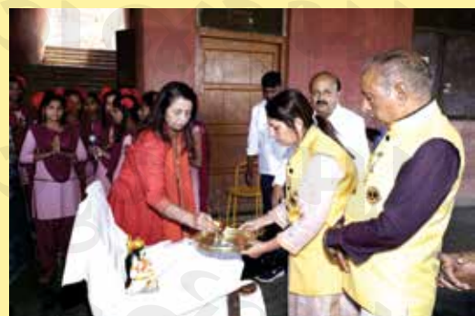
The auspicious pooja ceremony preceding the Inauguration of the borewell in Bhiwandi imbued the event with spiritual significance, invoking blessings for the success and prosperity