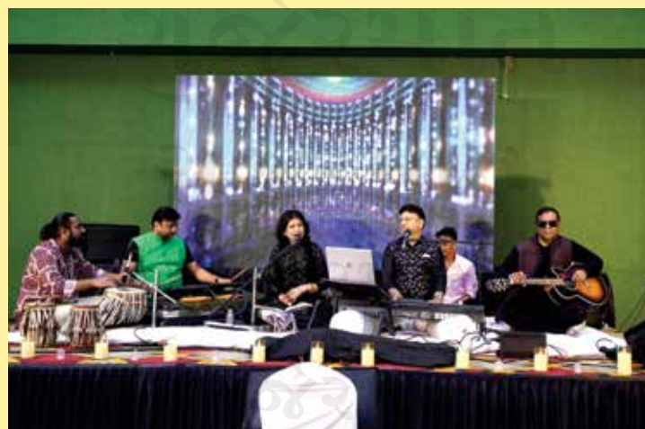
Guests reveled in the enchanting melodies and soulful rhythms of the Sufi night, immersed in an atmosphere of serenity and joy