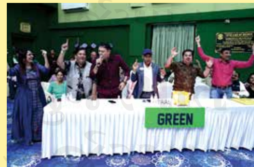
Lions Club Hosts Spectacular Musical Antakshari Event