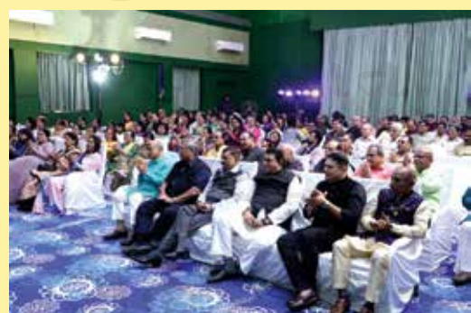
Guest Enjoying Sufi Night