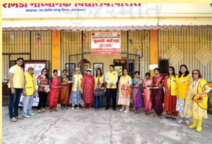
The inauguration of the borewell in Bhiwandi was a momentous occasion, marked by the presence of dignitaries and community leaders, symbolizing a significant step towards addressing water scarcity and fostering sustainable development in the region