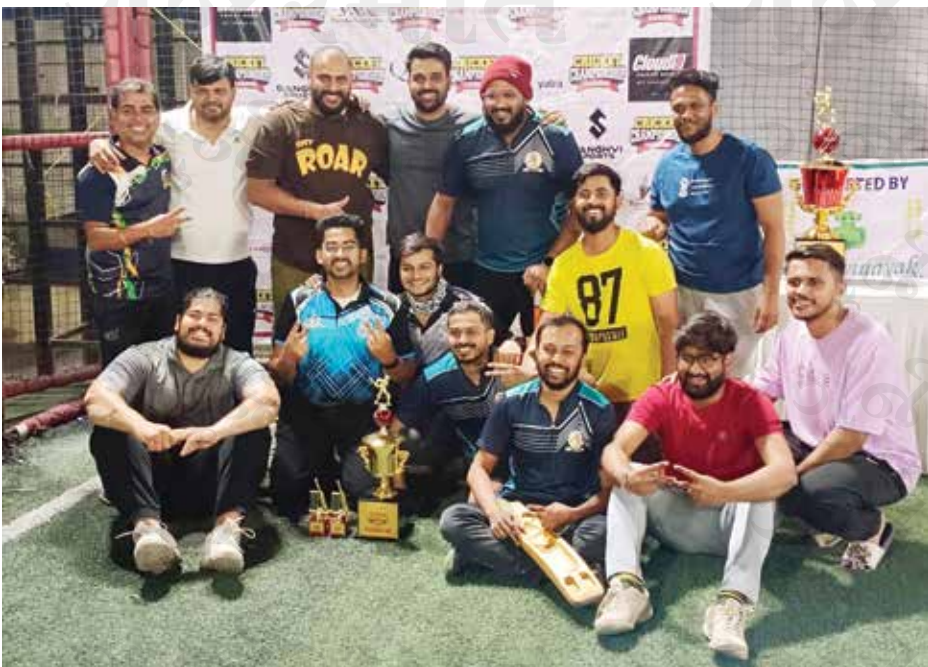
આશર ૧૬ - રનર અપ