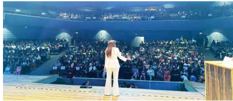
ઉપસ્થિત જનમેદનીને આવકારી રહેલા બિજલ ગડા

એકેડેમી એડ્રેસ : ૨૦૬, નેપચ્યુન અપટાઉન, એન.એસ. રોડ, શિવસાગર હોટલની ઉપર, મુલુંડ (વેસ્ટ).