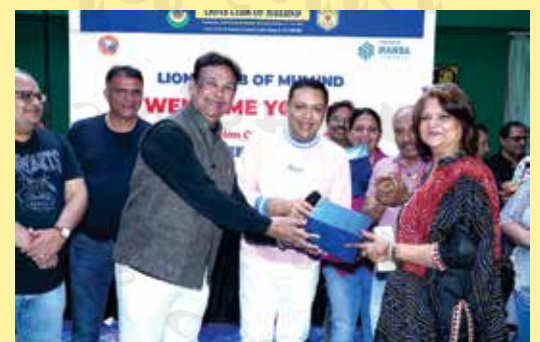
Lions Pavilion Hosts Prize Distribution Ceremony Following Games and Karaoke Event

Special Thanks to Manba Finance for Generous Support and Contributions